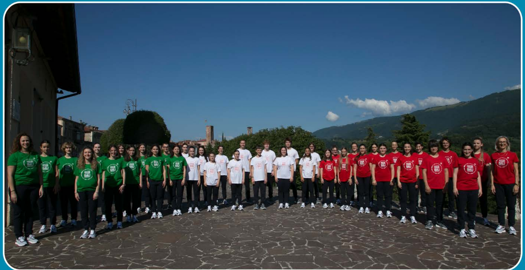
Bassano del Grappa