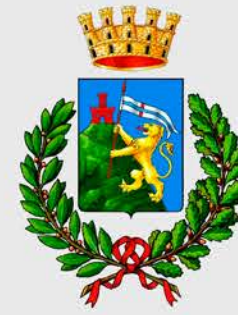
Città di Marostica