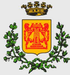
Città di Bassano del Grappa